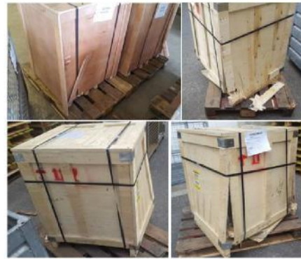
falsch / wrong

Bei Maschinen und Werkzeugen, die in Holzkisten verpackt werden müssen, sind für die Kisten stabile Holzplatten (OSB-Platten) mit einer Stärke von zwei Zentimetern zu verwenden. Die Kisten sind mit Stahlbändern zu umreifen. Die Verpackung in Kisten muss stabil und transportsicher ausgeführt sein.