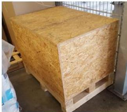
richtig / right