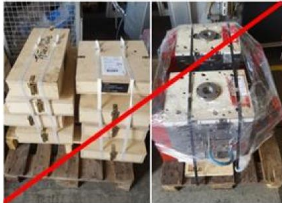
falsch / wrong