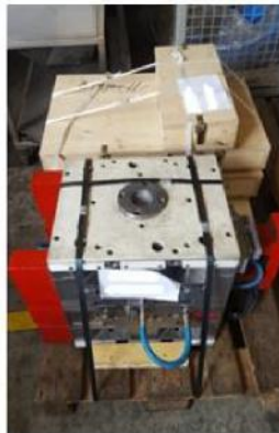
richtig / right

E.g.: Injection molding tools together with the installation parts (shuttle jig, etc.) on a pallet, no bundling of the installation parts of several tools on a pallet.