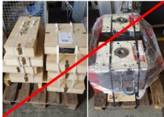
falsch / wrong