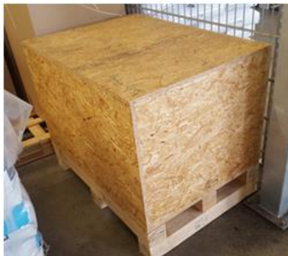
richtig / right