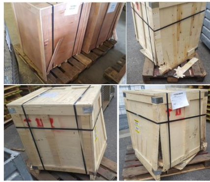
falsch / wrong

Bei Maschinen und Werkzeugen, die in Holzkisten verpackt werden müssen, sind für die Kisten stabile Holzplatten (OSB-Platten) mit einer Stärke von zwei Zentimetern zu verwenden. Die Kisten sind mit Stahlbändern zu umreifen. Die Verpackung in Kisten muss stabil und transportsicher ausgeführt sein.