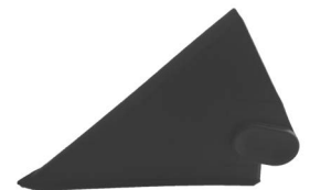
mit Griff / with grip

1) Nummernschlüssel für FIPLOCK® Zubehör / Part numbering key for FIPLOCK® accessories: www.fraenkische.com/fiplock-accsy-part-no