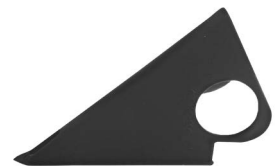
mit Loch / with hole